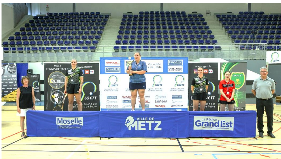
Championnats du Grand Est 2023 : podium Dames