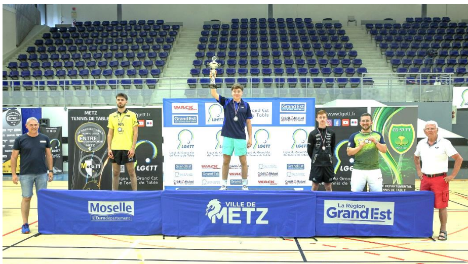
Championnats du Grand Est 2023 : podium Messieurs